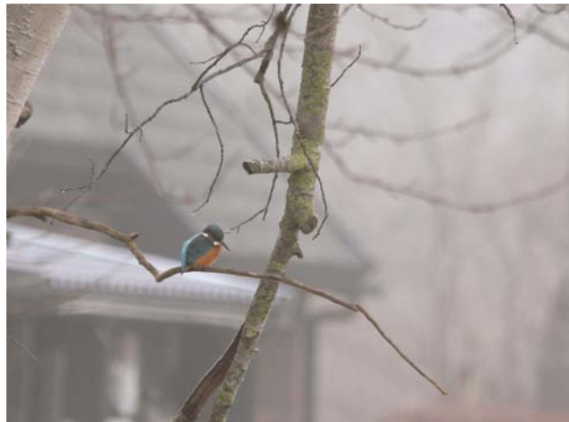
IJsvogel, Lauwersoog

De aantallen van Blauwe Kiekendieven, Ruigpootbuiszeters, Smellekens en Velduilen in oktober 2015 liggen rond de 12-jaarsgemiddelden voor deze soorten (zie tabel 3). Kennelijk waren in het telweekend in oktober heel veel Bruine Kiekendieven al uit onze regio vertrokken. Er werden in totaal maar 5 Bruine Kiekendieven genoteerd. Het 12-jaarsgemiddelde oktober voor de bruine kiek is 11,3. Vorig jaar oktober kwamen in het telweekend maar liefst 29 bruine kiekken op papier. Het aantal van 32 genoteerde Slechtvalken in oktober was maar 3 lager dan in de 'recordmaand' oktober 2014. Het 12-jaarsgemiddelde van de Slechtvalk is 20,6. Romke Kleefstra, Jan Kramer & Eric ten