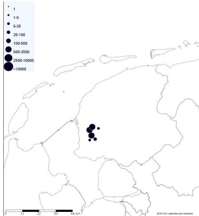
Figuur 1. Verspreiding van de Kleine Rietgans in Fryslân tijdens de ganzen telling in oktober 2015.

In tabel 2 staan de 'Nijsgjirrige soorten' waarbij de Grote Zilverreigers buiten beschouwing blijven. Daarvan telden we er maar liefst 970 en dat is excl. Lauwersmeer. Een gigantisch aantal voor een watervogeltelling in oktober en bijna evenveel als vorig jaar toen we er honderd meer telden. De Grote Zilverreigers