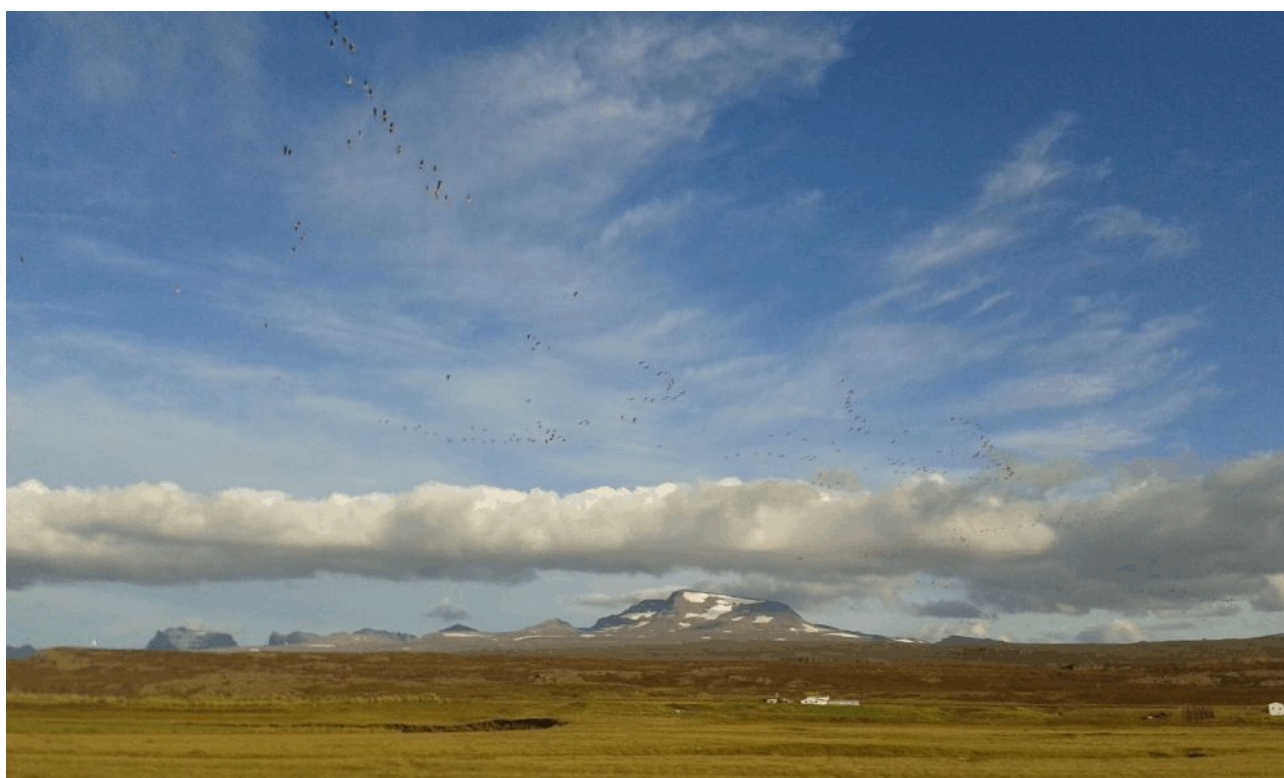
Grauwe Ganzen boven het IJslandse landschap nabij Eiðar

De novembertelling staat op het programma. Eigenlijk wel de ganzenmaand in het Friese binnenland met piek-aantallen Kolganzen, grote aantallen Brandganzen langs de kust en in het midden- en zuidwesten van de provincie en van oudsher veel Kleine Rietganzen. Dat laatste lijkt geschiedenis en dat komt in deze nieuwsbrief o.a. aan bod. We kijken terug op wat we zoal in oktober telden aan de hand van de ganzen, zwanen, Smienten, nijsgjirrige en extra soorten.