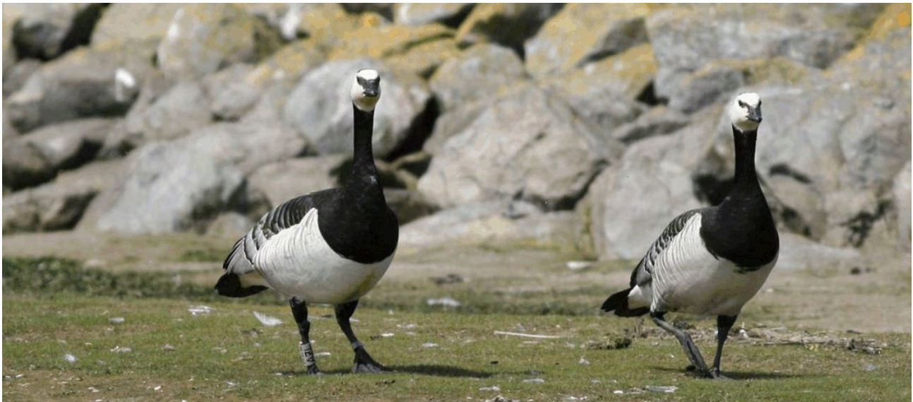
Dit Noorse koppel met een grijs geringd vrouwtje was zelfs in de zomer van 2013 nog in de Zeeuwse Delta.

elk koppel een grijs geringde partner, maar zonder jongen en twee andere koppels met in totaal 5 jongen. De geringde vogels zijn allebei op 26 juli 2012 in Oslo geringd. Eind december van dat jaar zijn de vogels bij Ferwoude gezien. Half mei 2013 waren ze weer terug in de directe omgeving van de Noorse ringplaats. Op 2 februari 2014 lieten ze zich weer bij Ferwoude bewonderen. Precies drie maanden later waren ze terug in Noorwegen, exact op de ringlocatie in Oslo. Op 25 oktober werden ze zo'n 16 kilometer oostelijker gespot, bij Lørenskog. Nog geen drie weken