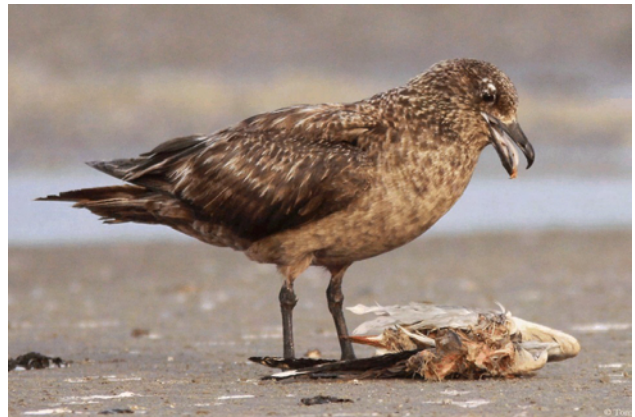
Grote Jager op Ameland

De tellers in het waddengebied Kees van Scharenburg, Marcel Kersten en P. Brouwer kregen bij hun telling in november 2014 op Ameland nota bene een Grote Jager op papier. Een bepaald opmerkelijke wintergast.