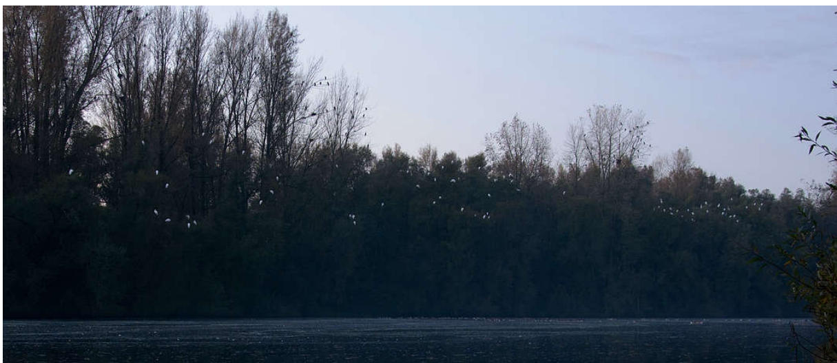
Foto: Slaappleats Grote Zilverreiger en Aalscholver, Havikerwaard. Rob Zweers.

Tellen kan van 4 tot en met 19 november, met als voorkeursdatum 11 november - aanvangstijd 7.20 ; zon op 07.52 uur