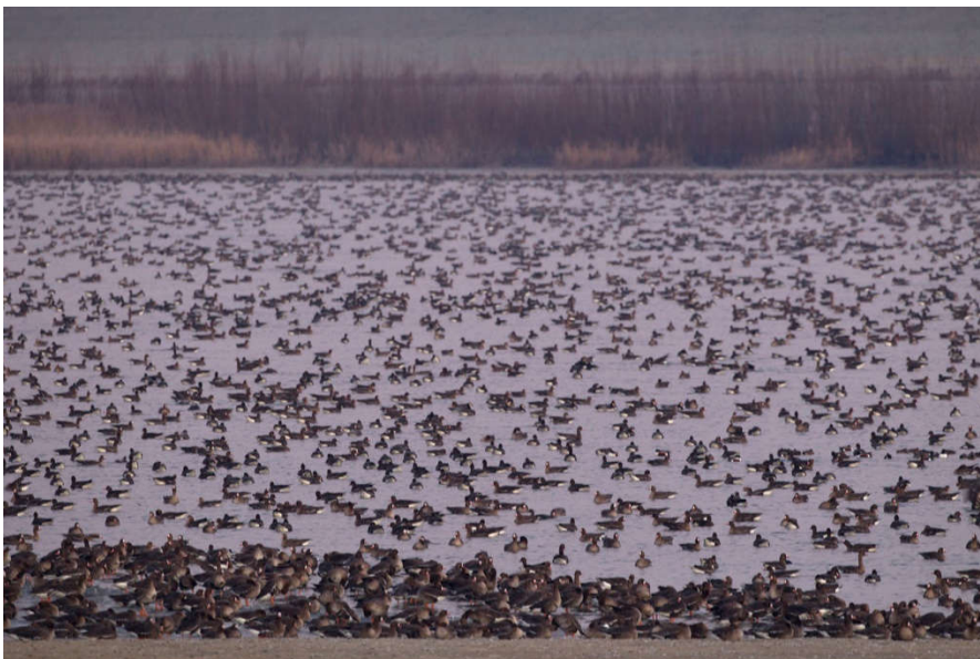
Foto: Slaapplaats Kolgans Kraaijenhof, Ooijpolder. 26 januari 2017.

Slaaplaatstelling Grote Zilverreiger. Tellen kan van 16 tot en met 31 december, met als voorkeursdatum 23 december - aanvang 15.30 ; zon op 08.47 uur; zon onder 16.30 uur.