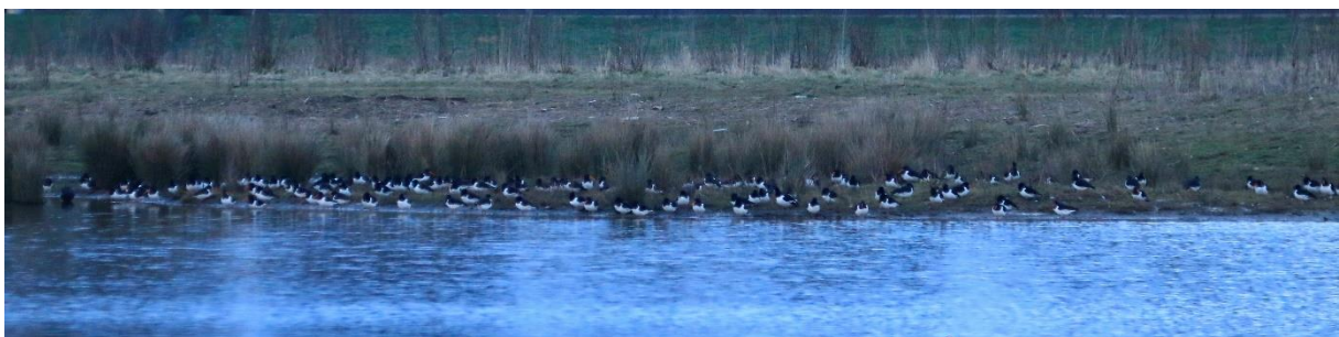
6 maart 2016

Grutto tenslotte had ook veel grote slaapplekken in Noord-Nederland, onder meer in de Grote Wielen (FR, 1500) en een recordaantal voor 2017 in de Alde Feanen (FR, 4300!). Naast het Hoge Noorden sliepen ook in de Polder Hardenbroek in de Biesbosch veel Grutto's, zo'n 1400. Het gemiddelde aantal Grutto's per slaapplek lag op 134, wat bijna naadloos past bij het gemiddelde plaatje voor alle jaren, 134.