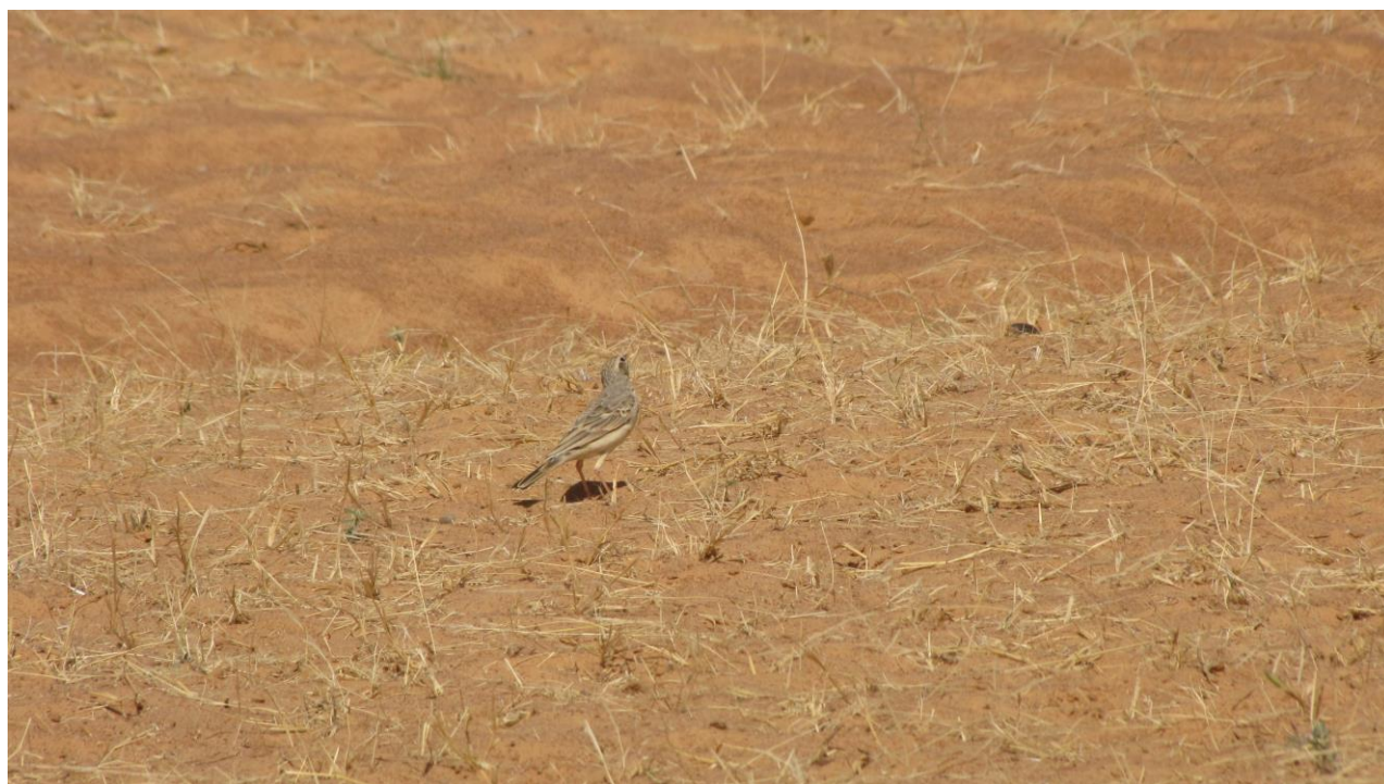
Foto 6. Duinpieper in Noord-Senegal (16 graden N), 15 december 2014. Je kunt hier goed zien hoe weinig begroeiing er op de grond is achtergebleven. Uiteraard ziet het er hier in de regentijd heel anders uit, maar dat zullen de duinpiepers niet meemaken (alweer vertrokken).

Van de duinpiepers in West-Afrika hebben we, voor zover dat ging, ook foerageergedrag genoteerd, en vluchtafstanden. Het gaat te ver daar verder op in te gaan. Hier volstaat het de zone van voorkomen vrij nauwgezet te hebben gedefinieerd.