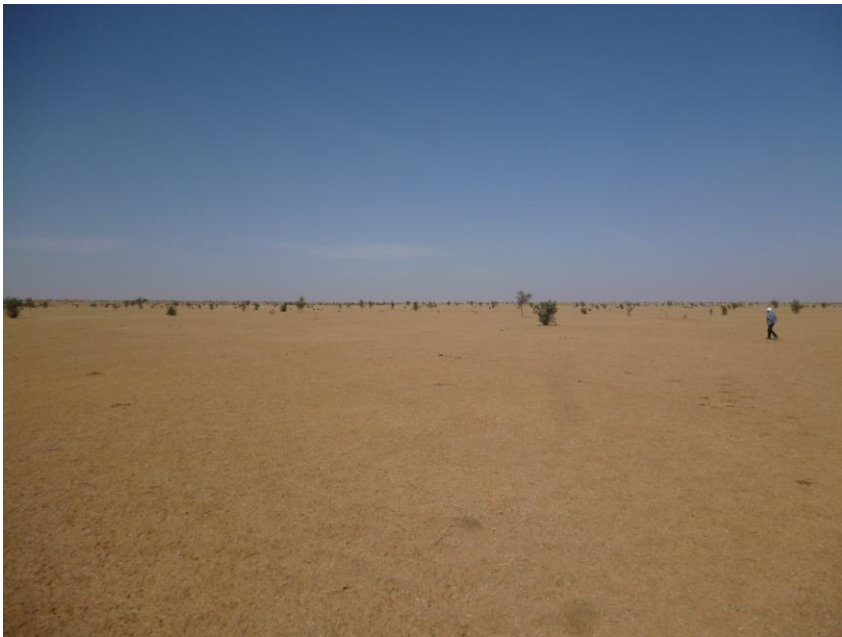
Foto 3. Dezelfde locatie als op de vorige foto, om een indruk te geven van de leegte van het gebied. Rechts loopt Jan van der Kamp (met een Afrikaanse staat van dienst van 40 jaar) aan de buitenzijde van de 50 m brede en 300 m lange poot van een raai. De foto is genomen van de linkerzijde van de raai; tussen beide waarnemers worden alle vogels binnen de raai eruitgelopen. Elk boompje wordt net zo lang bekeken tot 100% zeker is dat alle aanwezige vogels – met paraferalia - zijn gezien en genoteerd. Alleen door ter plekke systematisch waarnemingen te verzamelen kom je achter de omstandigheden die onze vogels in Afrika tegen het lijf lopen, en wat daarop van invloed is.