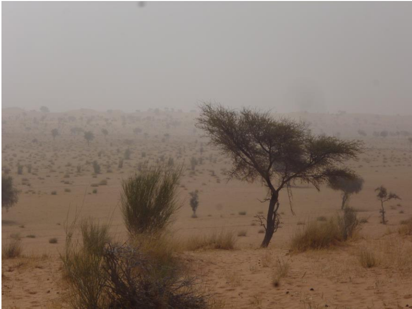
Foto 4. De Mauretaanse woestijn die we bezochten ter hoogte van 17.5° N bestaat uit aeolische duinen waartussen zich eindeloos lange valleien bevinden die begroeid zijn met – vooral – Acacia tortilis, 19 december 2014. Voor duinpiepers net wat te noordelijk, maar geschikt overwinteringsgebied voor tapuiten. Bij noordenwind is het zicht beperkt en lopen neus en oren dicht met stof. Rochelen geblazen.