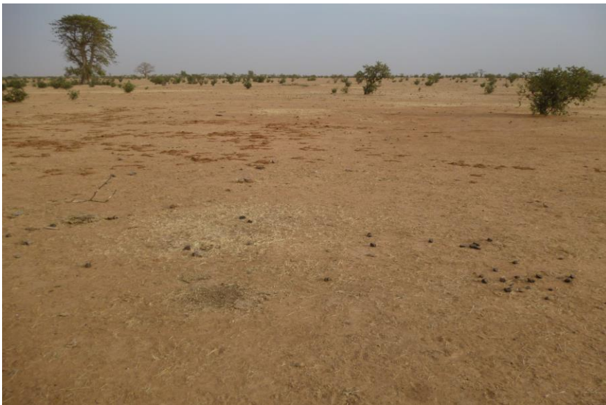
Foto 1. Overwinteringsgebied van duinpiepers in de Ferlo, Noord-Senegal, 14 december 2014. Een boomarme, kaalgegrasde bende (let op de keutels van koeien, ezels en geiten) op 16°N, met verspreide groei van Boscia senegalensis (en een enkele Baobab). Hier zagen we een handvol duinpiepers, deels buiten de raaien.