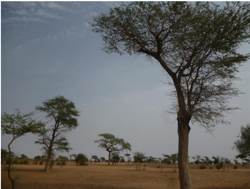
Foto 5. De forse, maar behoorlijk door mensen afgetakelde Faidherbia albida op de achtergrond in het midden van de foto fungeerde als schaduwplek voor een duinpieper op het heetst van de dag, Noord-Senegal, 22 december 2014. In feite is dit landbouwgebied (verbouw van gierst, veeteelt) met verspreide boomgroei, waar het vee na de oogst de laatste resten bodemvegetatie opruimt. Veel zuidelijker dan deze plek (16° N) zul je zelden duinpiepers aantreffen.