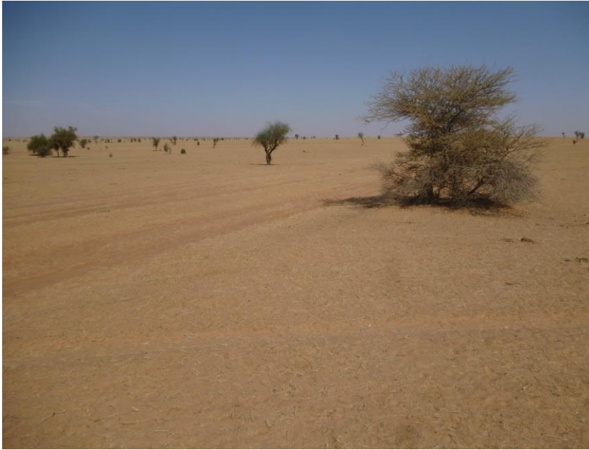
Foto 2. De kleine Acacia tortilis op de voorgrond fungeerde als schaduwplek voor een duinpieper, in Zuid-Mauretanië op 18°N (dan zit je feitelijk al in de woestijn), op 18 december 2014. Deze kale wereld is de kenmerkende habitat van Renvogel en Hopleeuwerik, en kennelijk dus ook van Duinpieper.