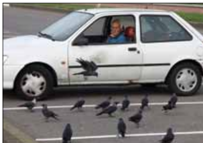
▲ Huiskraaien en kauwen bij een geliefde voedselbron. Hoek van Holland, 28 oktober 2012.

traditioneel de beste plek voor huiskraaien, zaten geen vogels. Het restaurant bleek op maandag gesloten te zijn, waardoor er geen frietjes en andere lekkernijen op de grond lagen. Dit zou de afwezigheid van huiskraaien aldaar goed kunnen verklaren.