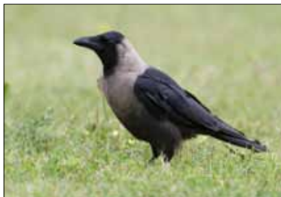
▲ Sinds augustus 2012 is een huiskraai van ondersoort Corvus splendens zugmayeri in Hoek van Holland aanwezig; 28 augustus 2012.