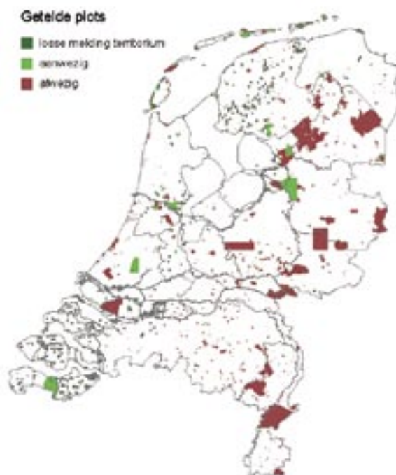
Figuur 2. Gebieden waar in 2006-2009 Bruine Kiekendieven werden geteld.

De eerste Bruine Kiekendieven zijn inmiddels alweer terug uit westelijk Afrika. Op dit moment zijn evenwel duizenden Bruine Kiekendieven nog onderweg naar West-Europa en vliegen misschien op dit moment over de Pyreneeën of de Middellandse Zee om dadelijk in gebieden zoals de Vendée of de Camargue even op krachten te komen. Next stop: Nederland! Niet wetende dat Nederland dit jaar in het teken staat van deze geweldige vogel. Samen met honderden, zo niet duizenden enthousiaste vogelaars gaan we proberen om zo veel mogelijk potentiële broedgebieden geteld te krijgen. Zoals altijd staat of valt het succes van de extra aandacht voor een Soort van het Jaar met uw beslissing om mee te doen. Uw hulp kunnen we dus goed gebruiken!