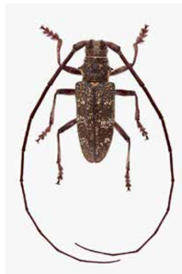
Sparrenboktor ( M. sutor ), noordelijke geelschildboktor ( M. urussovi ) en dennen-geelschildboktor ( M. galloprovincialis ).