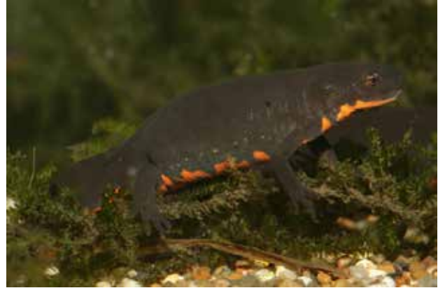
Soorten als de Chinese vuurbuiksalamander ( Cynops orientalis ) worden in grote aantallen wereldwijd verhandeld in de terrariumhandel.

Frank Pasmans: “Gezien het maatschappelijk belang van het behoud van Europese biodiversiteit, die door deze schimmel bedreigd wordt, is het zeer dringend dat overheden middelen vrijmaken om dit probleem snel en adequaat aan te pakken.”