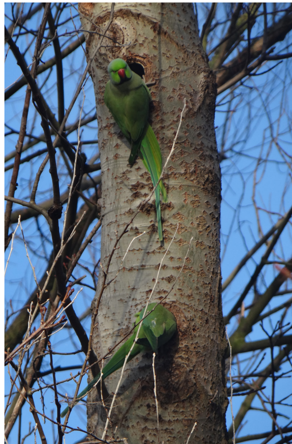
Halsbandparkieten inspecteren nestgaten.

Buiten deze broedverspreiding die zo'n 134 atlas-blokken (5x5 km) beslaat volgens www.vogelatlas.nl , is de soort op Waarneming.nl in 2016-2017 uit nog eens 132 atlasblokken