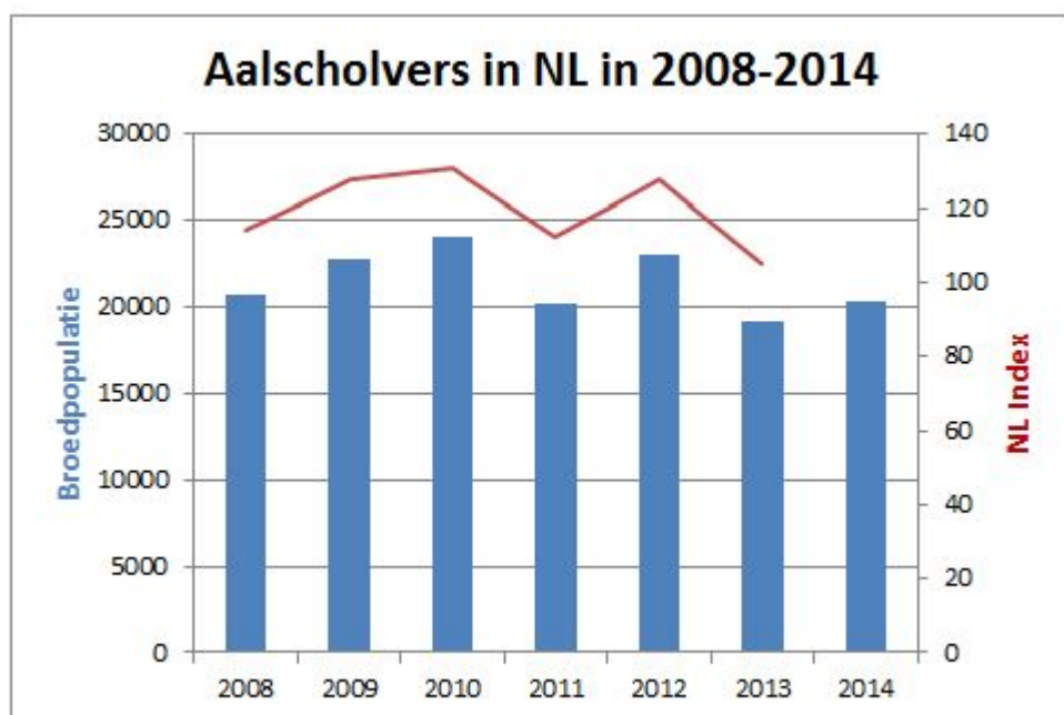
Figuur 1: kolonies geteld in de jaren 2008 t/m 2014

Waard bij Haaften GL. Voor het laatst werd hier een kolonietelling verricht in 2011. Ook in Noord-Scharwoude NH is ons een aalscholverkolonie bekend waarvan sinds een aantal jaren telgegevens ontbreken. Tussen de N242 en de Oostelijke randweg bevindt zich een kleine kolonie op een eilandje in een meertje. Hier werden in 2012 nog 45 paren geschat vanaf de kant. Als u informatie heeft over deze kolonies dan horen wij dat graag!