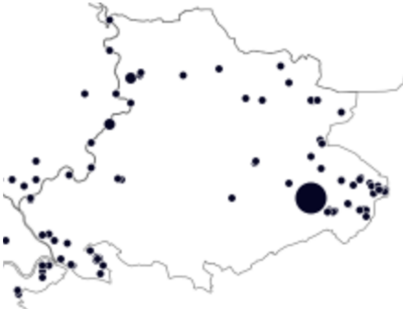
Verspreiding van de Ijsvogel 2010-2012 in de Achterhoek

Er zijn zo al verschillende zeer verrassende vondsten gedaan. Je moet soms wat moeite doen om de geïsoleerde territoria op te sporen! Watervogels zullen het naar verwachting goed doen en het is daarom raadzaam om nog eens rond te gaan in de broedvogelblokken die in 2013 geteld zijn; mogelijk zijn een aantal soorten talrijker dan het afgelopen jaar (Ijsvogel ?). Nieuwe schattingen kunnen gewoon toegevoegd worden in het huidige jaar.