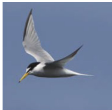
Dwergstern 2 juni 2007.

Ook de Dwergstern is bij ons kustgebonden. In 2008 waren er in ons land 25 kolonies, waarvan er echter slechts 11 tenneste 10 broedparen telden. De grootste kolonie was die van de Hooge Platen met 250 paren (figuur 1). De kolonie op de Stampersplaten in het Grevellingmeer telde slechts 42 paren