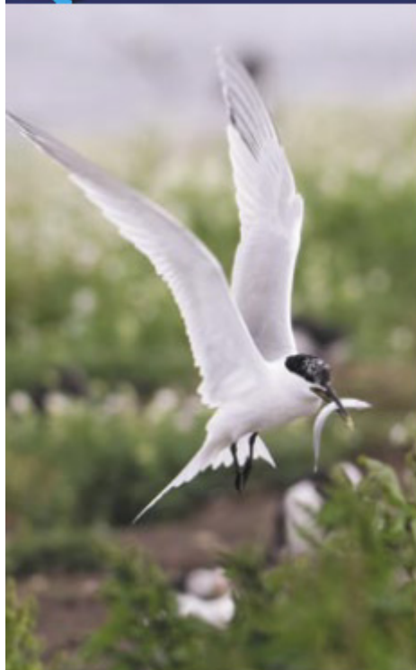
Grote Stern, 20 juni 2007, Broedkolonie Inver Ferne UK