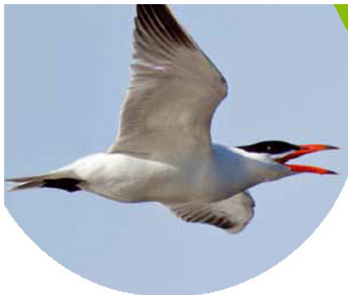
Reuzenster op steeds meer plaatsen gezien. Meers (Li), 30 april 2012.