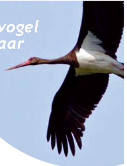
Zwarte Ooievaar, 28 mei 2008, Grevenbicht.