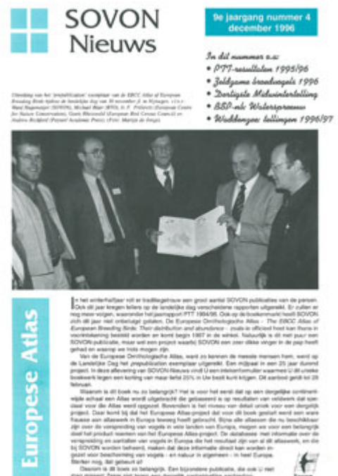
Sovon-Nieuws 9(4): 1996 Presentatie van de Europese Atlas op de Landelijke Dag

In de jaren zeventig publiceerden verschillende Europese landen, waaronder Nederland, hun eerste broedvogelatlas. Dat smaakte naar meer...zou een Europese broedvogelatlas niet mogelijk zijn? Er