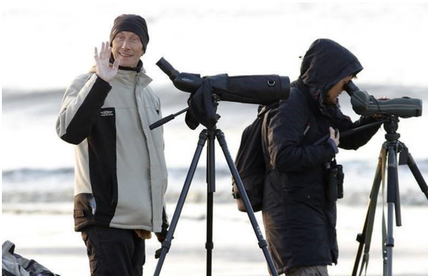
Er worden steeds meer kleurringen afgelezen.

De organisaties achter de website zijn blij dat er steeds meer onderzoekers met hun projecten meedoen. De onderzoeksgegevens worden daardoor veilig en langdurig opgeslagen en de gebruiksrechten worden goed gewaarborgd. Voor de vogelaars die een kleurring aflezen en willen melden is het fijn dat ze waarnemingen meteen via BirdRing en submit.cr-birding.org kunnen verwerken. Onderzoekers die aansluiten overwegen [5], kunnen zich melden via project@cr-birding.org [6].