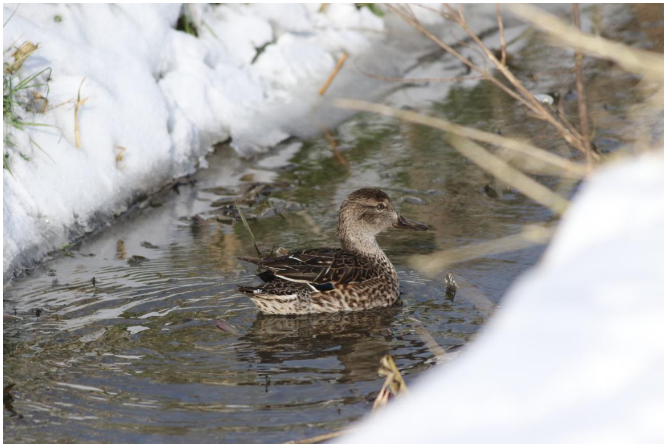
Wintertaling in een klein open stukje water.