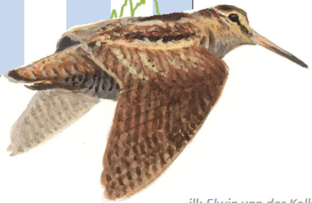
ill: Elwin van der Kolk