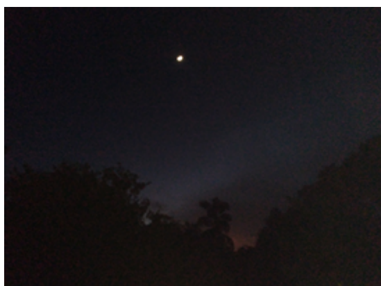
Night: geen spoor van natuurlijk restlicht.

Het is echt nacht. Aan de horizon is geen streepje licht meer te zien. Een individuele boom is in het bos niet te zien. Over het algemeen laten de genoemde uilensoorten zich (ook) in deze fase horen. In de meeste gevallen zijn ze pas echt actief in deze fase.