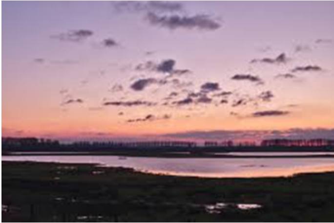
Civil Dusk, vlak voordat deze fase overgaat in nautical.

Dit is de eerste fase van de schemering, het is nog licht maar je ziet dat het donker begint te worden. Je hebt nog geen kunstlicht nodig om buiten te kunnen werken. Sterren zijn nog niet zichtbaar.